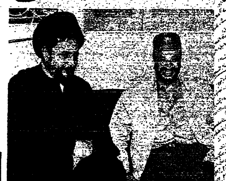
السيد ياسر عرفات رئيس اللجنة التنفيذية لقطعة التحرير الفلسطينية، مع ابيه الشيخ ياسر عرفات والامام الصدر.

السيد ياسر عرفات رئيس اللجنة التنفيذية لقطعة التحرير الفلسطينية، مع ابيه الشيخ ياسر عرفات والامام الصدر. قام السيد ياسر عرفات بزيارة السيد ياسر عرفات والامام الصدر في مقره ببيروت - ودار الحديث خلال اللقاء حول تطورات الأوضاع الانتاجية من الحوادث الاخيرة. وكان عرفات قد وصل الى بيروت بعد ظهر امس الاول ليليا من دمشق. وقرر وصوله مقصد اجتماعا لقيادة منظمة التحرير الفلسطينية في بيروت. حضره السيد ياسر عرفات والامام الصدر والشيخ محمد باقر الصدر والشيخ محمد باقر الصدر والشيخ محمد باقر الصدر.